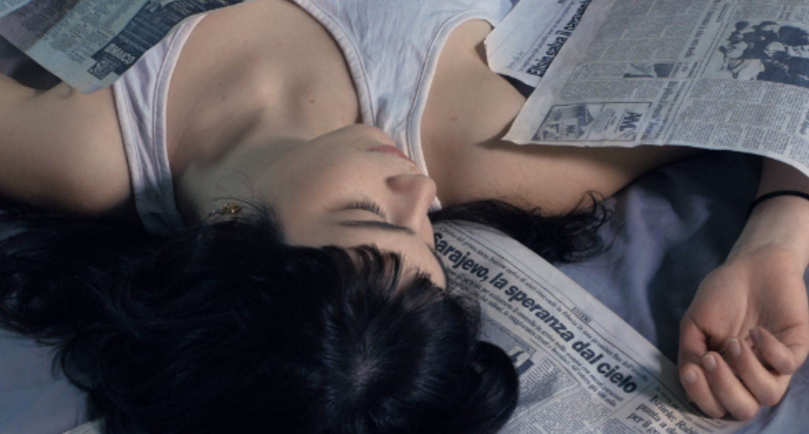
La ragazza di Trieste.