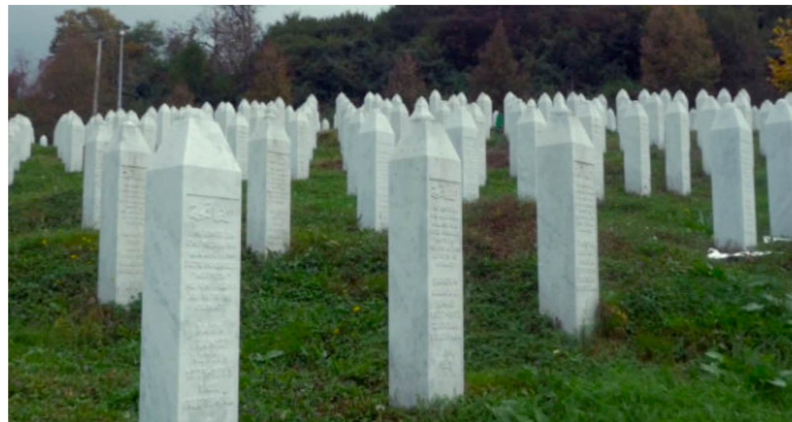
Il memoriale di Srebrenica.