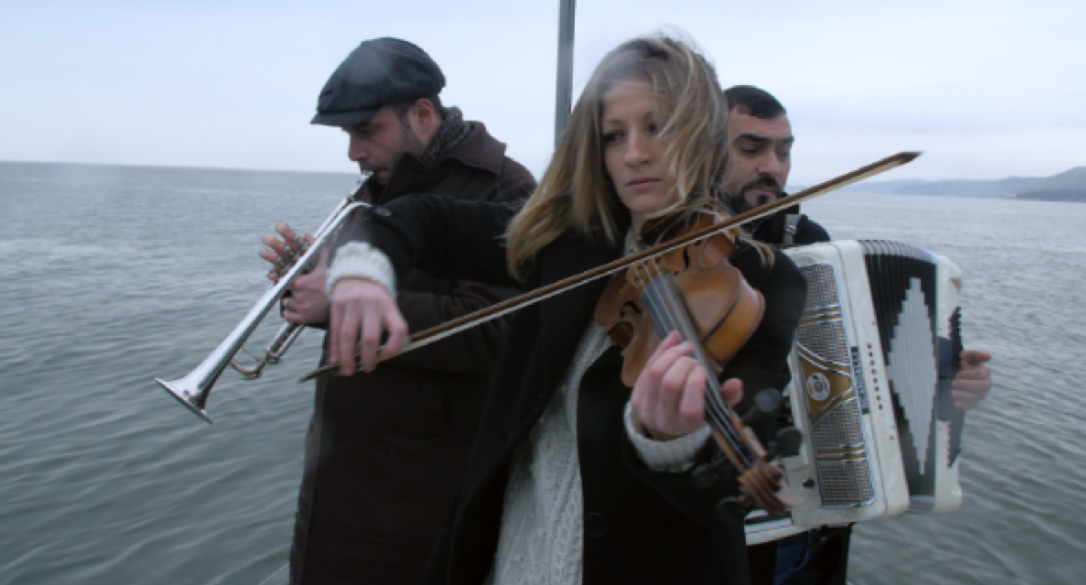
I tre musicisti sul mare come le tre repubbliche in guerra.