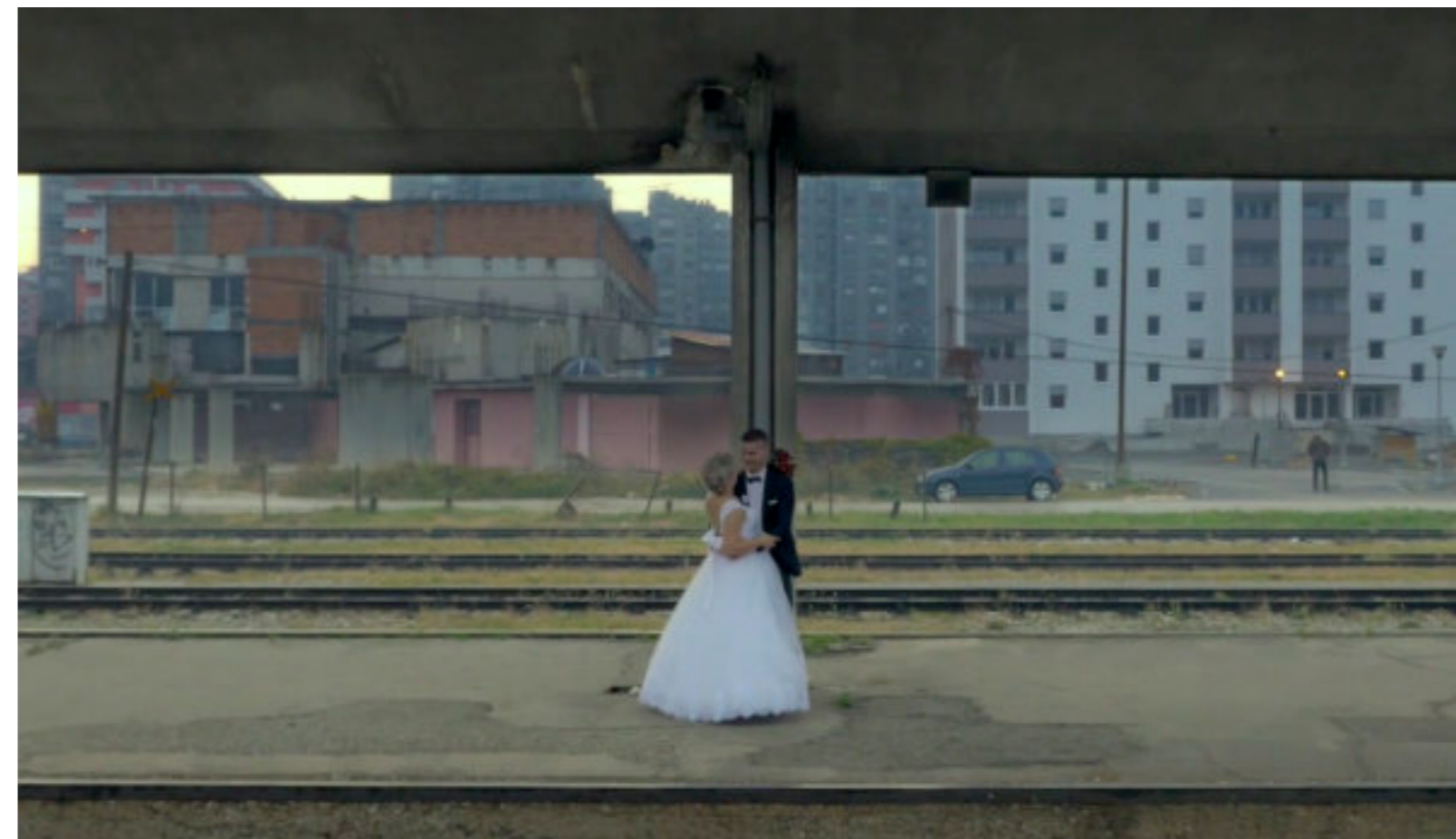
Gli sposi di Tuzla.

perdersi innumerevoli volte all'interno di quella giostra spaventosa e affascinante chiamata Bosnia. Nel documentario, la parola, il commento, che inizialmente volevo banditi, sono stati uno strumento fondamentale per raccontare i mille interrogativi. Le immagini da sole non erano sufficienti a restituire quella complessità che percepivo alla fine di ogni giornata di riprese quando assistevo sconfitto al giudizio dei bosniaci che nemmeno tanto velatamente mi guardavano convinti di veder crollare l'ennesimo straniero giunto fin lì munito di buone intenzioni. Bosnia Express è la terza tappa di una trilogia iniziata nel nel 2003 con La rosa più bella del nostro giardino , proseguita nel 2004 con Adisa o la storia dei mille .